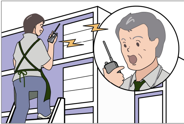
日常業務で…倉庫の在庫確認

売り場と倉庫との在庫確認や駐車スペースの誘導など、従業員間の連絡用として威力を発揮します。タイムセールなどのご案内も、店内のどこからでも移動しながら、放送することが可能です。